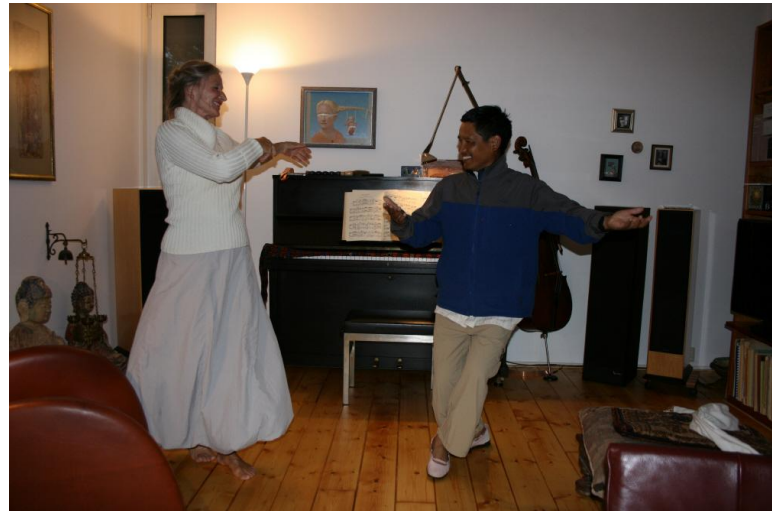
....eindelijk weer dansen op Nepalese muziek