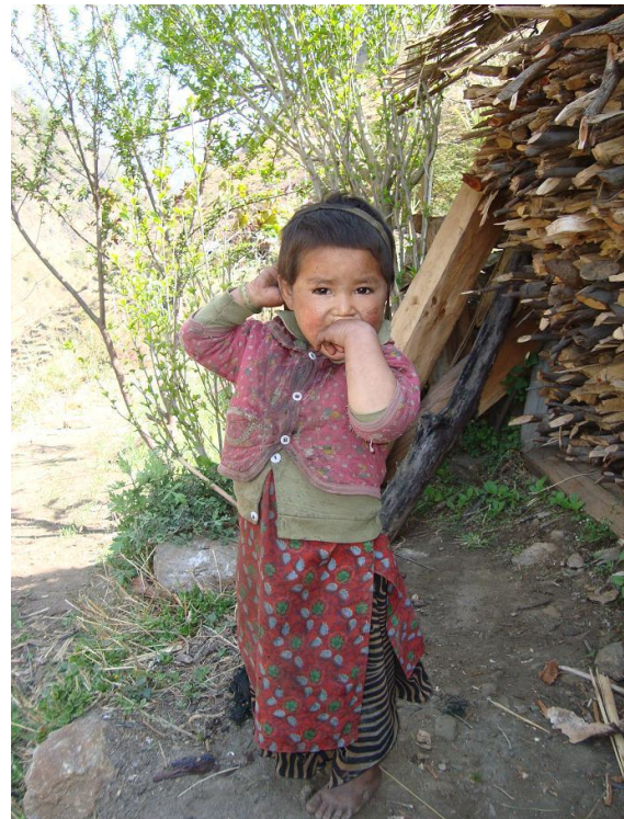
Niet bepaald uit weelde, maar wel praktisch