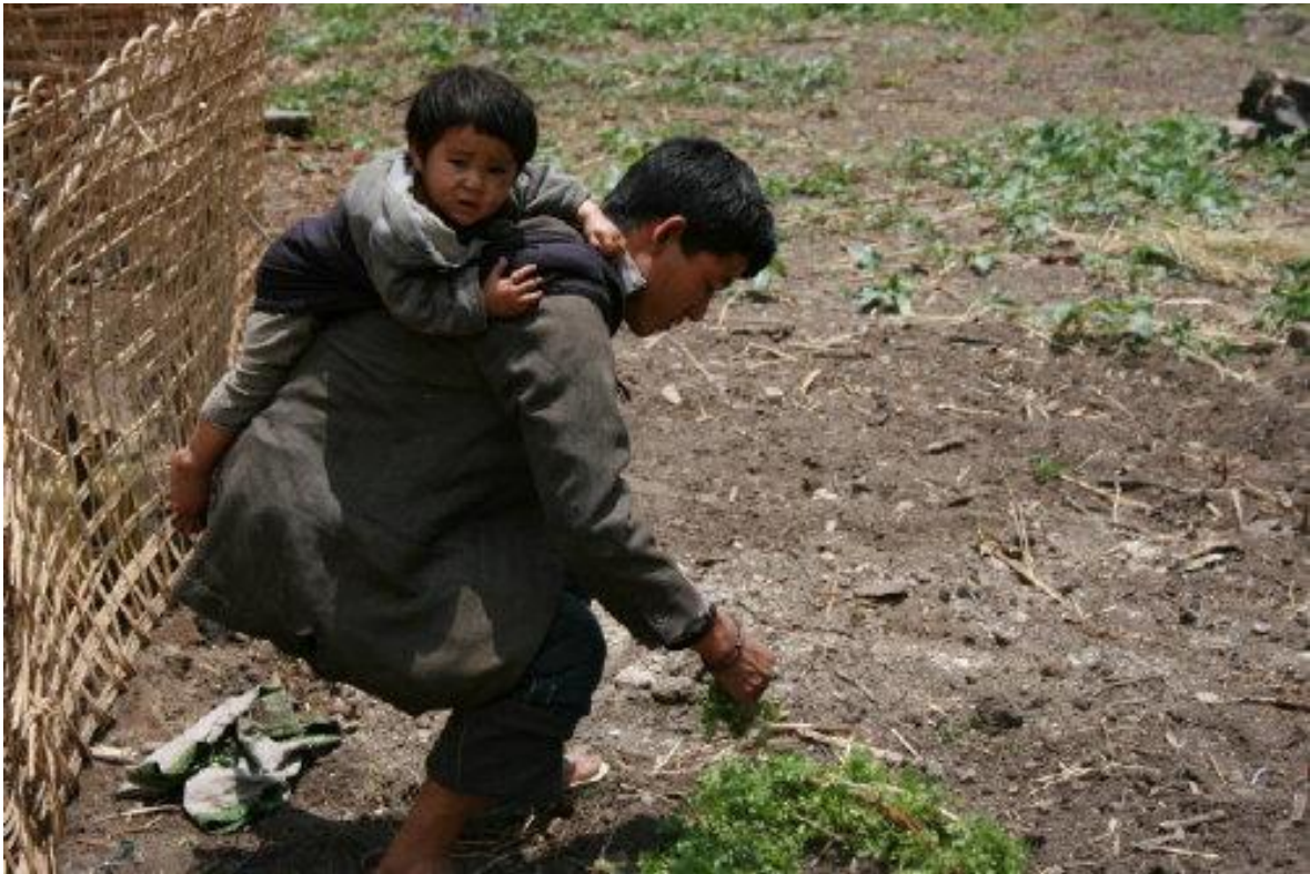
De groenten- en kruidentuin levert maar uiterst spaarzaam enige ingrediënten op voor de soep.